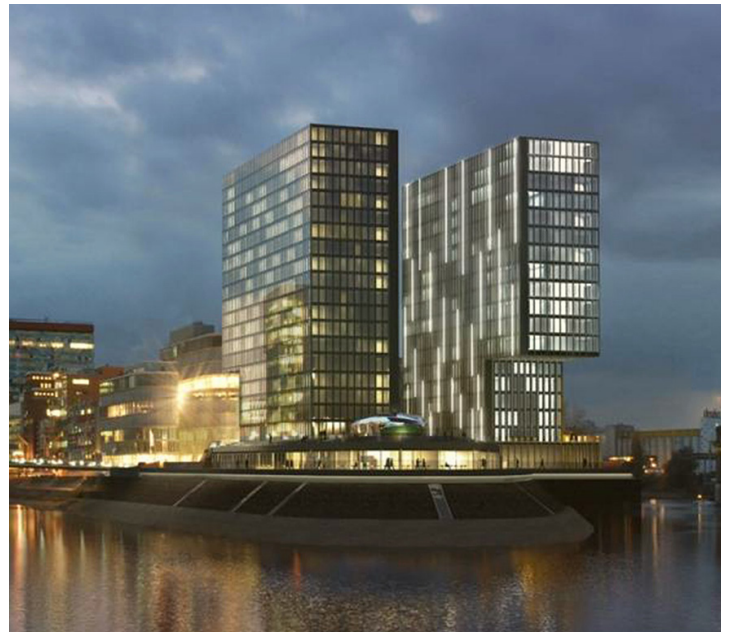
Hyatt Regency Düsseldorf, Germany