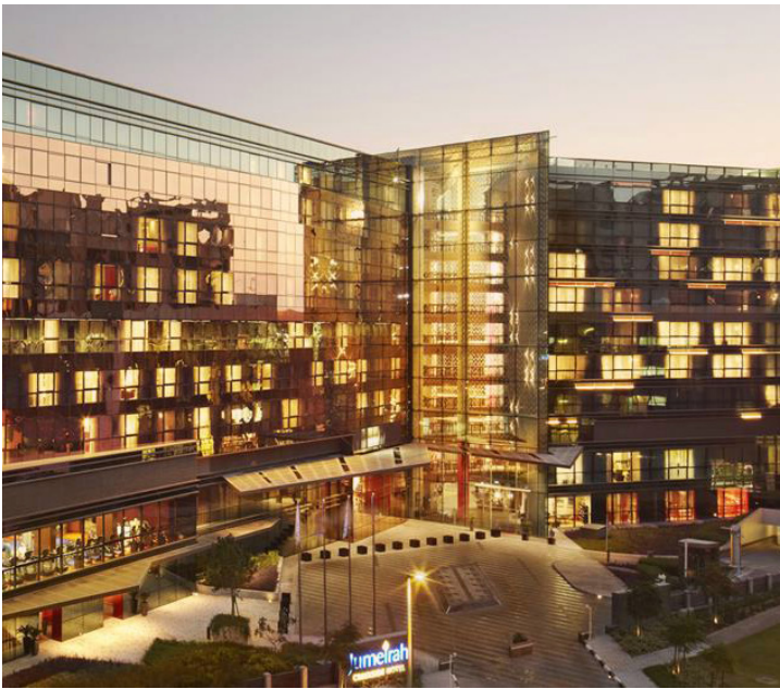
Jumeirah Creekside Hotel, Dubai, UAE